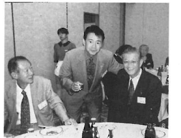
ガバナーと語る会