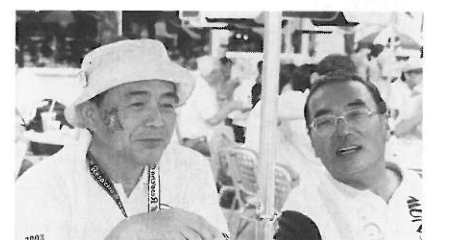
国際大会大阪大会にて