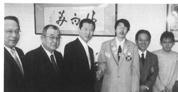
YE生トーマス君、市長への表敬訪問