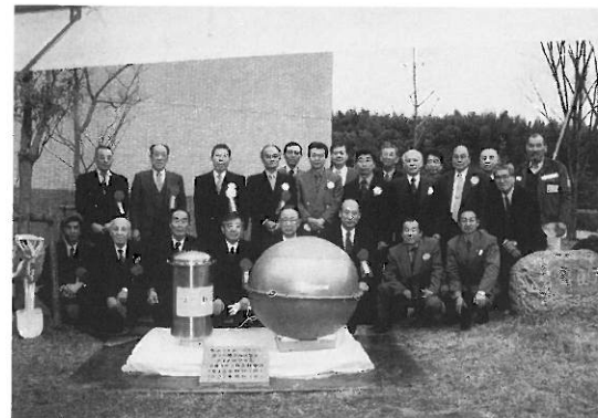
亀山LC タイムカプセル