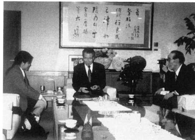
ハイ・ビッチャンさん 市長へ表敬訪問