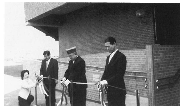
名張市体育館へ身障者用スロープの寄贈の贈呈式