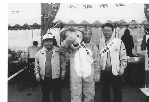
アクティビティ 献血運動