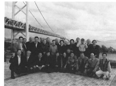
役員・事務局員研修会