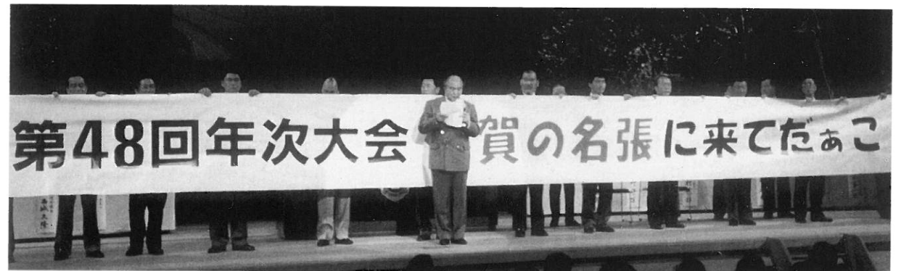
2002年 第48回年次大会 名張で開催をアピール