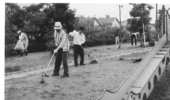
汗の奉仕 中央公園及び子ども支援センターの 草刈及び剪定・掃除