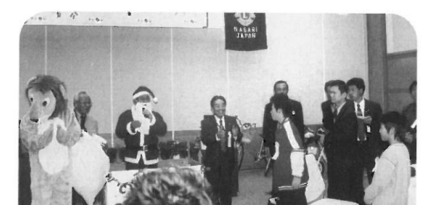
養護学園の子どもたちとのクリスマスパーティー