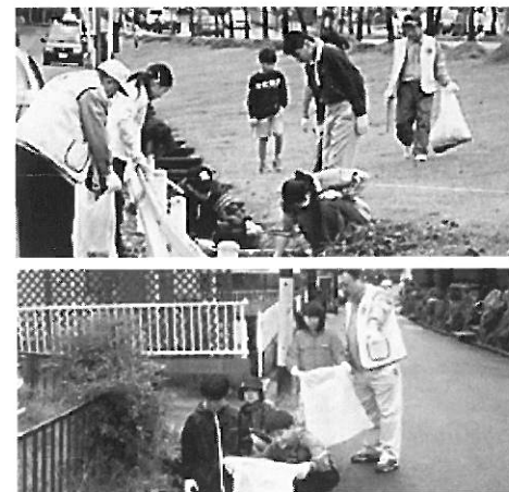
桔小(5~6年生)生徒と地域清掃