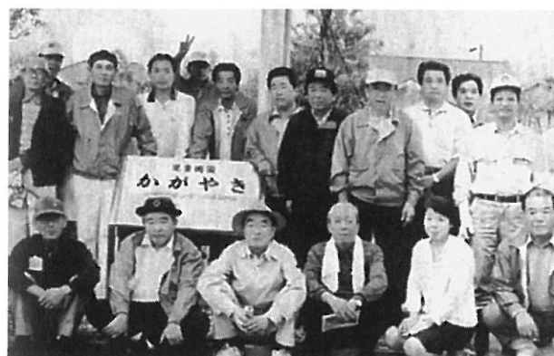
汗の奉仕を終えて