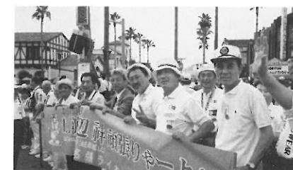
国際大会大阪大会にて