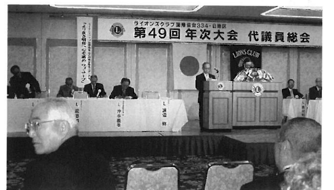
年次大会 代議員総会