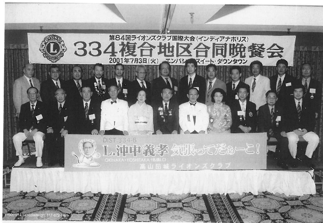
Lions Club International "MD334 Dinner" July 3, 2001 - Indianapolis, Indiana U.S.A.

力ながら努力する決意であります。 昨今、経済環境は極めて厳しく、不透明さが漂っている中で、キャビネット運営にも困難さが予想されます。また、「改革」が社会的な課題になっている現在、クラブ活動にも、時代の変化に適応した創意工夫が必要と考えますので、「不言実行」に徹し、全力を尽くしたいと思います。 今後は皆様方のご指導とご鞭撻を頂きながら334-B地区の発展のために邁進する所存でありますので、何卒ご協力を宜しくお願い申し上げます。