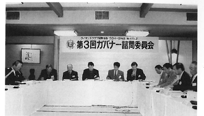
ガバナー諮問委員会