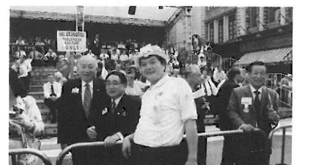
国際大会大阪大会にて