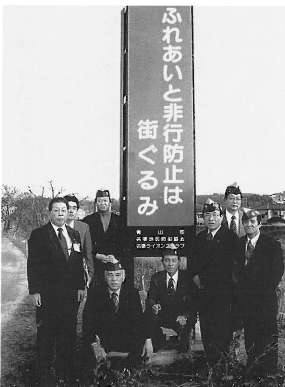
青山町へ「防犯灯」と「防犯啓発塔」寄贈