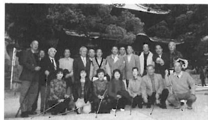
役員・事務局員研修会