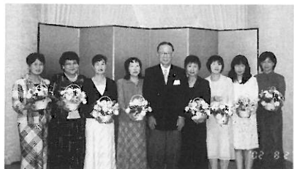
ゾーン内事務局員の皆さん