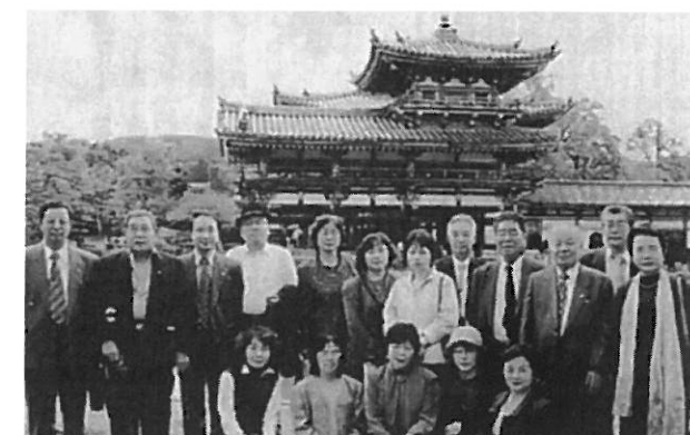
宇治平等院の観光組