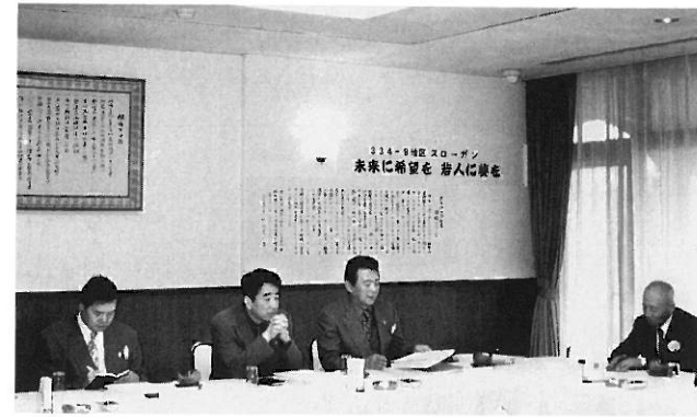
ガバナー諮問委員会