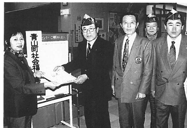
青山町福祉協議会へ寄贈