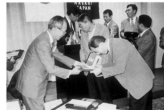
第4R・RC L.葉山よりLICF.メルビン・ジョーンズ・フェロー権を受ける会員