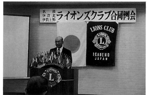
3クラブによる合同例会