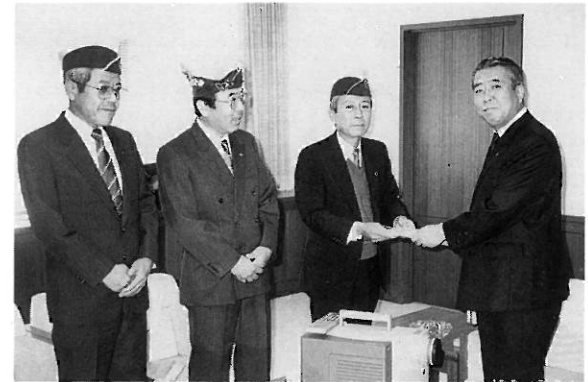
「100インチ液晶ビジョン」を市長に贈呈するメンバー