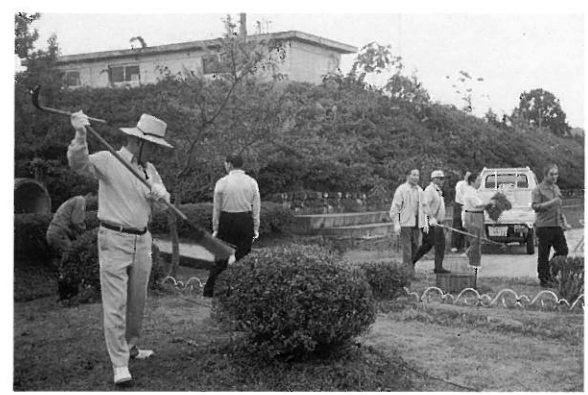
奉仕作業に励む会員