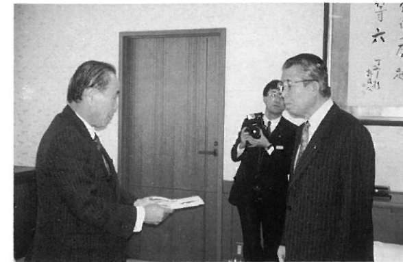
市長に目録を渡す金沢尾山L.C会長