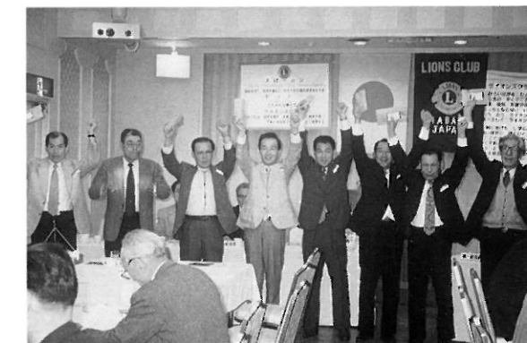
記念品を受けロアーで応える会員