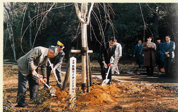
記念植樹(しだれざくら)姉妹提携クラブへ贈呈