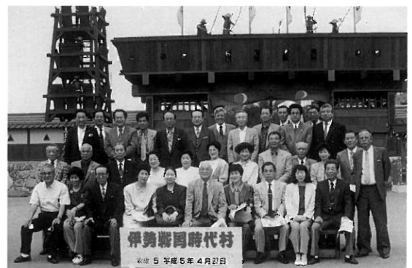
家族例会で「伊勢戦国時代村」を訪れたメンバーとネス