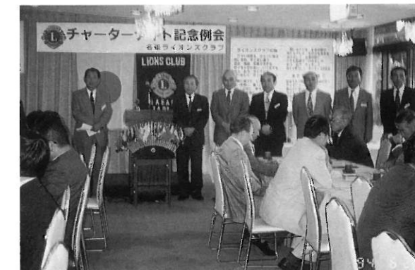
楽しさいっぱいのチャータナイト記念例会