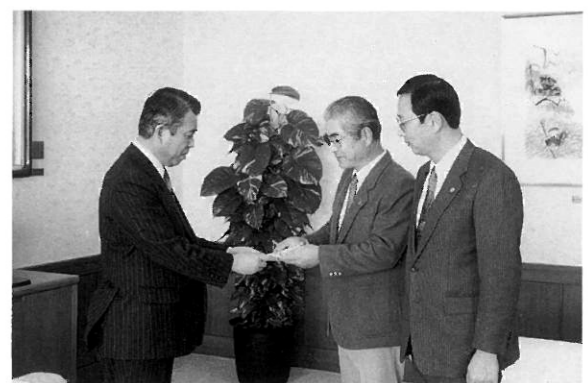
歳末助合いチャリティを富永市長に手渡す会長