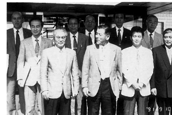
企業訪問例会 オキツモ(株)の正門前で