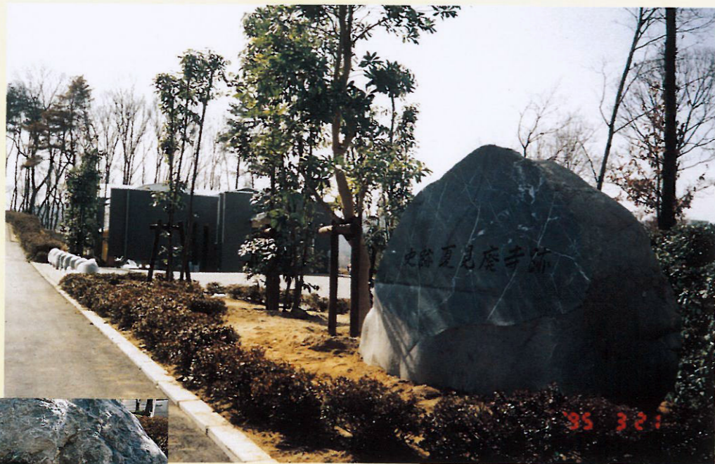
史跡 夏見廃寺標碑建立