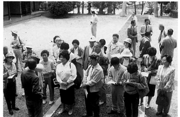
歴史探訪で説明を受ける新市民