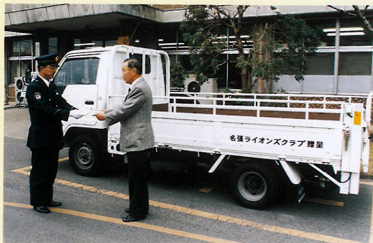
名張警察署へ 普通貨物自動車1.5トン(幌、昇降機付)寄贈