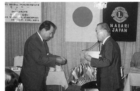
新旧会長の引き継ぎ（お互いに宜しく）