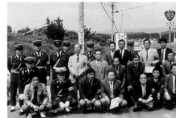
設置された「交通啓発塔」前で記念撮影