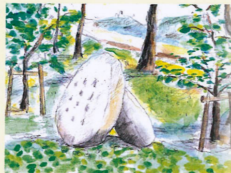
史跡 夏見廃寺跡 大来皇女万葉歌碑建立

碓の上 すゑのうへ に生ふる馬酔木 ばすいぼく を手折らめど 見すべき君 きみ が在りといはなくに