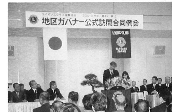
合同例会で挨拶するガバナー