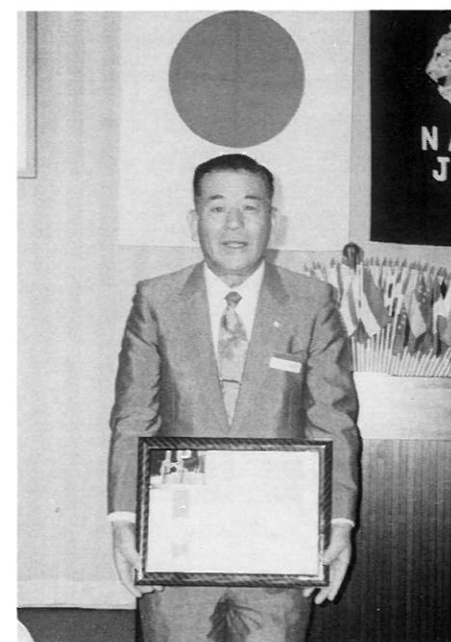
第38回年次大会（長野）に於いて国際会長感謝状を受けた会長