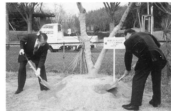
20周年記念植樹を行う